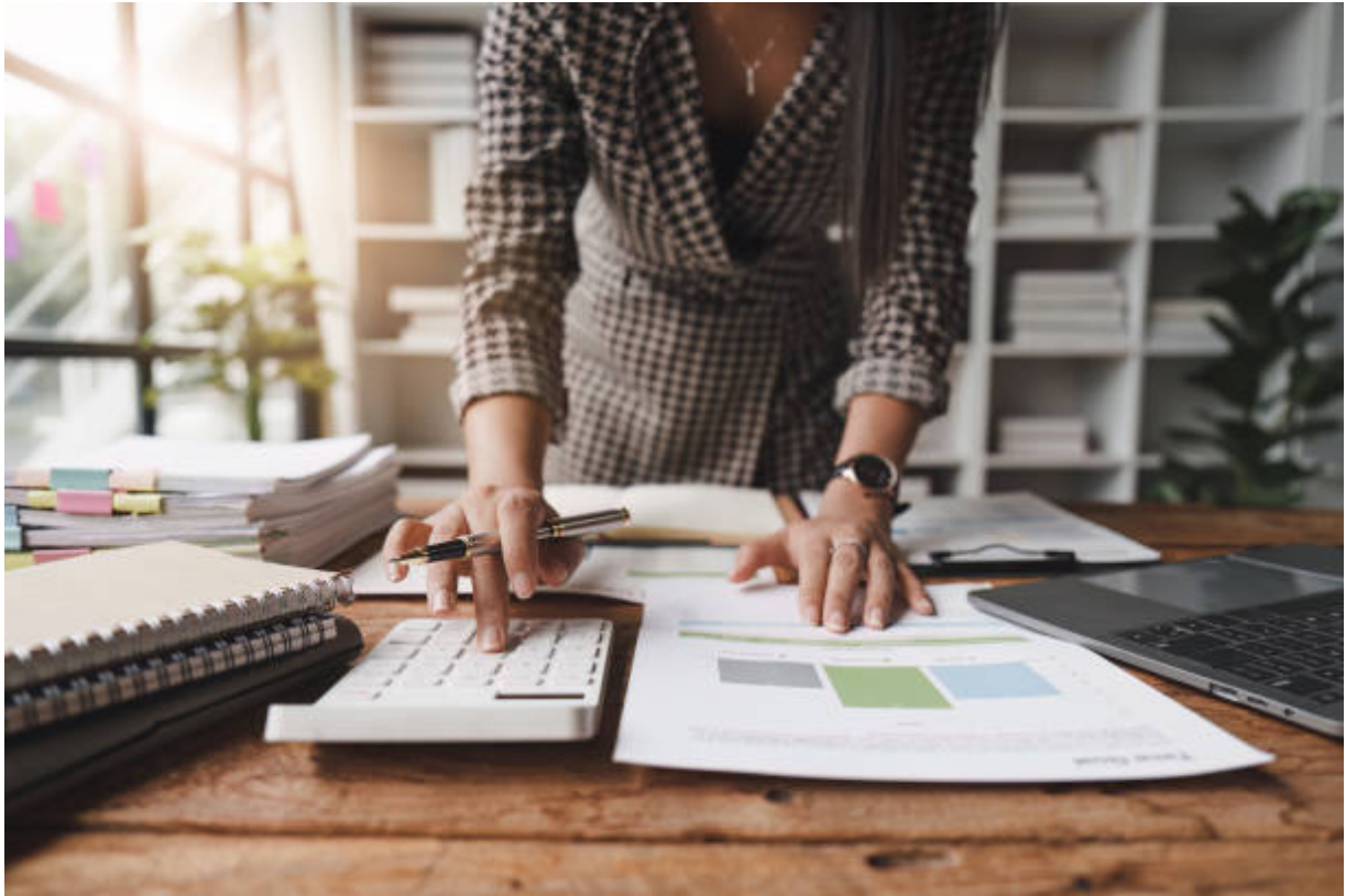
Información económica relativa a gastos