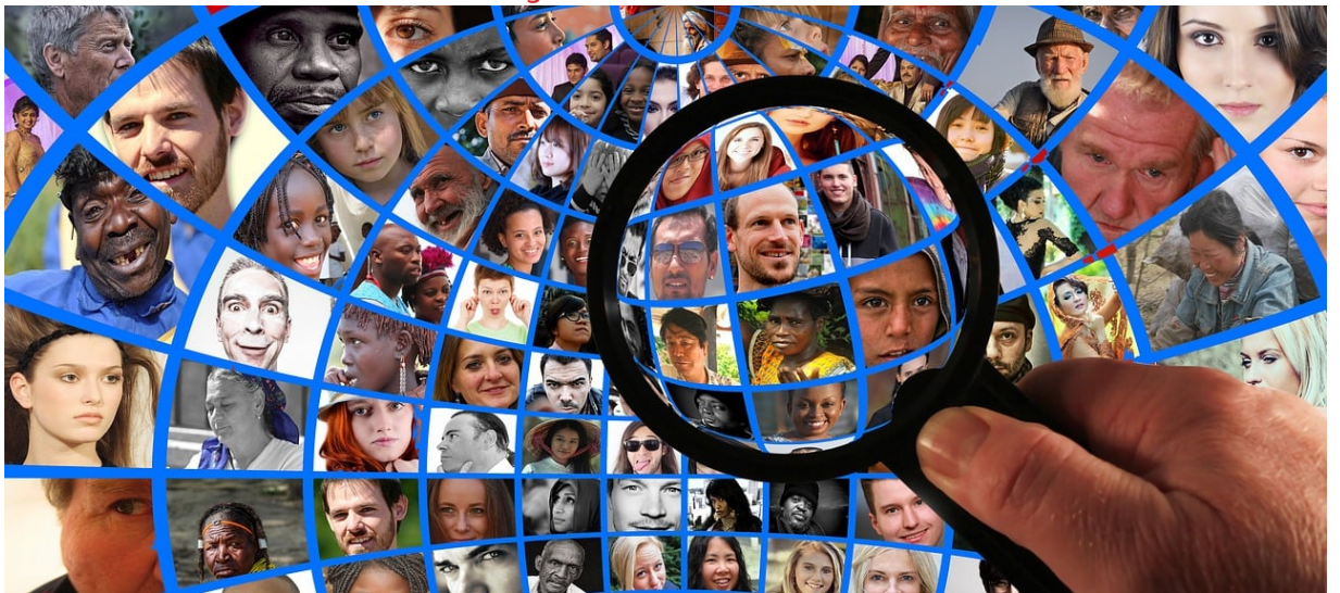
Análisis de la plantilla y resumen de gastos de personal