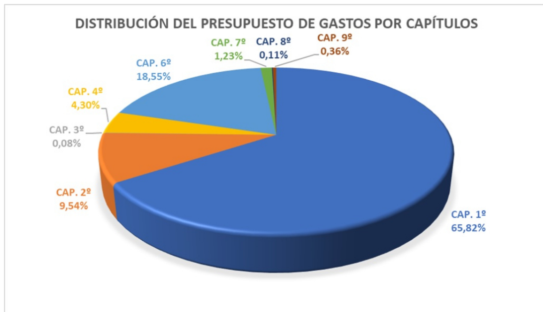
Gráfico distribución del presupuestos de gastos por capítulos 2024